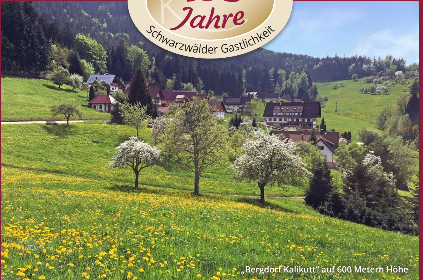
„Bergdorf Kalikutt“ auf 600 Metern Höhe